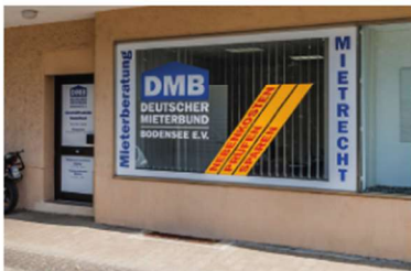
Das Kompetenzzentrum für Mieter: Unsere Beratungsstelle in Radolfzell

Mieter brauchen einen starken Partner, gerade am teuren Bodensee. Sie finden ihn im Deutschen Mieterbund Bodensee. Wir sind die soziale Stimme in unserer Region und bieten Mietern streitbaren Sachverstand. Wenn die Miete steigt, wenn Ihre Wohnung einen neuen Eigentümer bekommt, wenn die Betriebskosten explodieren oder wenn teure Modernisierungen anstehen, helfen wir.