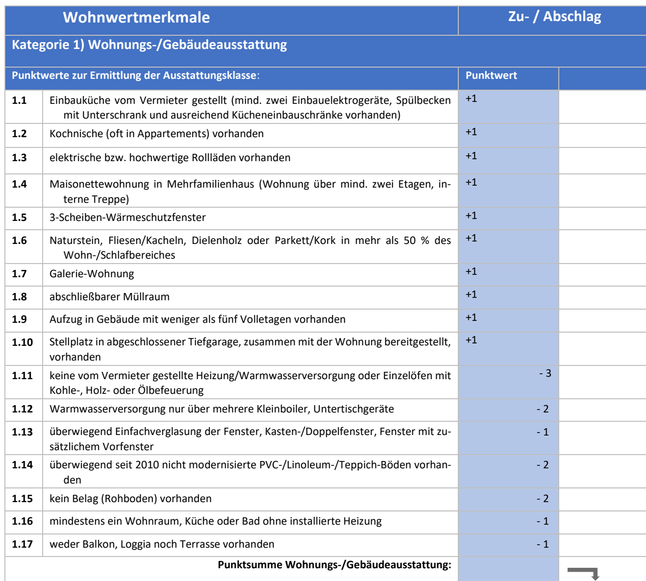
Tabelle 2: Weitere Wohnwertmerkmale, die den Mietpreis signifikant beeinflussen